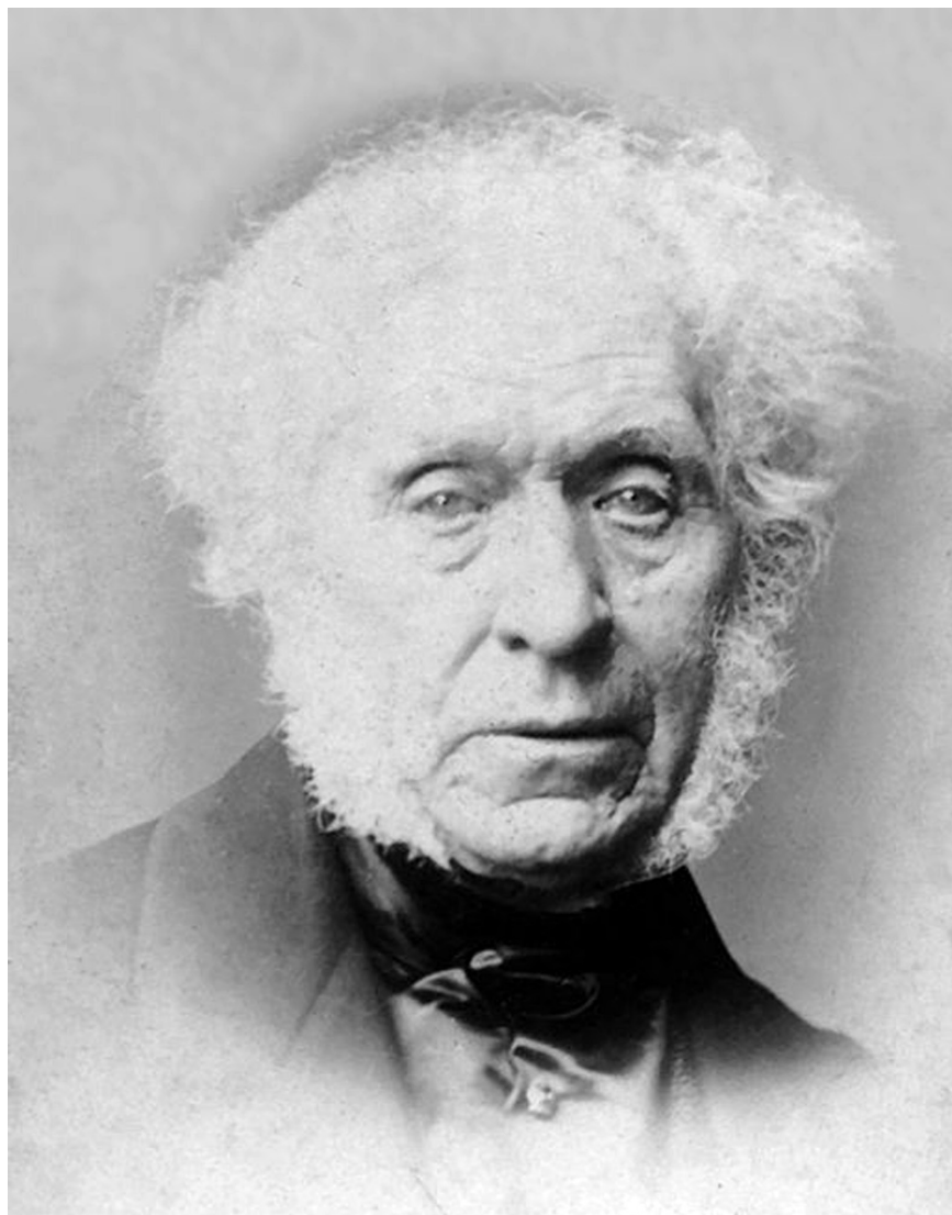
David Brewster (11.12.1781–10.2.1868)