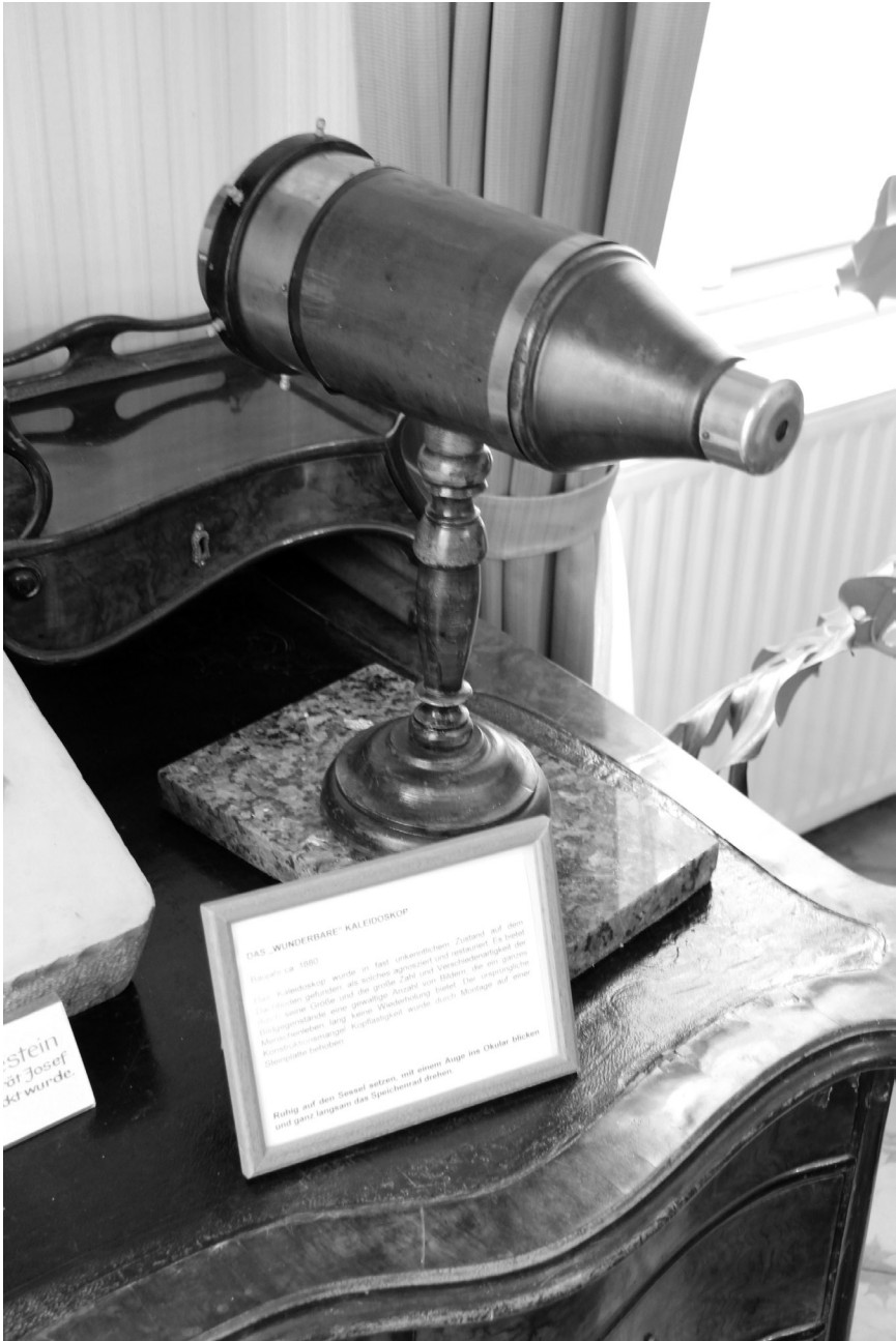
Kaleidoskop in der Hyrtl Bibliothek im Museum Mölbling, Niederösterreich