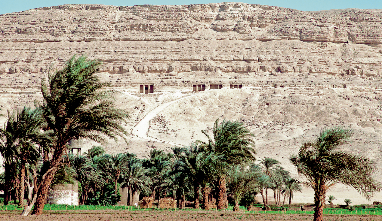
Abb. 2: Beni Hassan, obere Nekropole mit den großen Felsgrabanlagen des Mittleren Reiches, Blick nach Osten.

Gräber zählen zu den bedeutendsten Leistungen des Kunstschaffens jener Epoche. Vor allem das Grab des Chnumhotep II. (»[Der Gott] Chnum ist gnädig«) gilt als Meisterleistung altägyptischer Künstler.